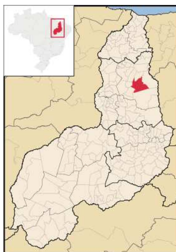
FIGURA 1: Localização do Município de Castelo do Piauí

O município Castelo do Piauí está localizado na região centro-norte do estado do Piauí (FIG. 1), a 184 km de Teresina, próximo à cidade de Campo Maior. O município tem uma área de 2.064 km 2 e conta com 18.550 habitantes (IBGE em 2000). As atividades econômicas predominantes na cidade são: agricultura, pecuária e extrativismo mineral. O IDH – Índice de Desenvolvimento Humano é de 0,656, segundo o Atlas de Desenvolvimento/PNUD (2000).