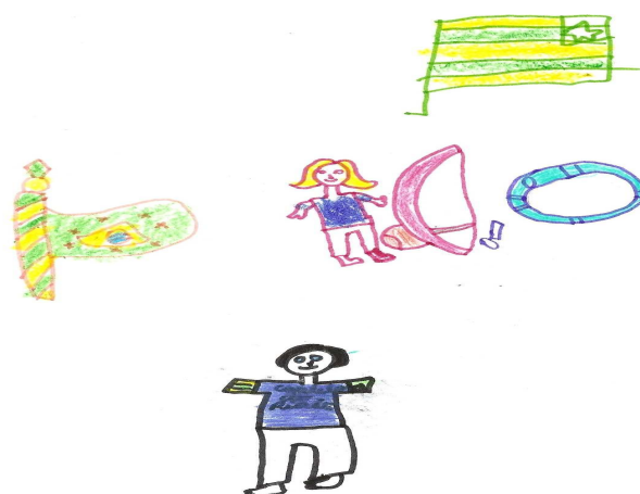
FIGURA 8: Desenho produzido por uma das crianças atendidas pelo projeto no trabalho de campo da pesquisa

O alcance do programa Se Liga ainda é pequeno, possuindo número de crianças atendidas inferior ao desejado. Em ambas as experiências, há necessidade de ampliação do número de alunos atendidos, a expansão das ações para a zona rural e a ampliação dos espaços físicos. Essas demandas são reconhecidas pela coordenação dos projetos, que, no caso do espaço físico destaca: