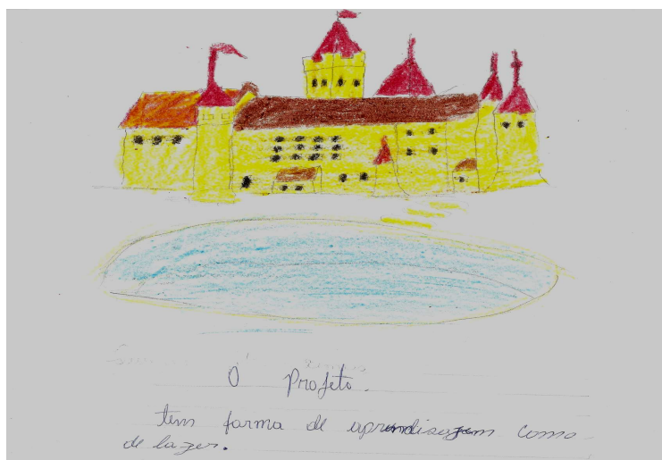
FIGURA 6 - Desenho produzido por uma criança atendida pelo projeto, no trabalho de campo da pesquisa

O Programa Se Liga, por sua vez, propicia ao aluno uma atividade de ensino no contraturno. É um programa emergencial voltado para a alfabetização de crianças no Ensino Fundamental. Alguns avanços são apontados pelos diretamente envolvidos no programas: